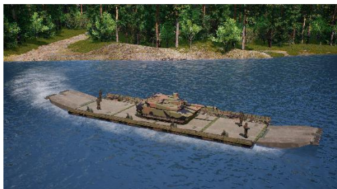
Ferry 4+2 - MLC 90T/80W

Toujours à l'écoute des besoins des armées, le groupe industriel propose une nouvelle génération de solution de franchissement pour les véhicules les plus lourds.